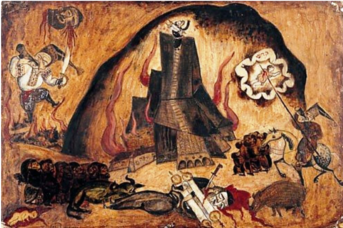
«Погром», худ. Иссахар-Бер Рыбак, 1919

Еще одна тема, поднятая Абрамсоном, касается проблемы формирования в армии УНР отдельных еврейских подразделений. Несмотря на в целом положительную реакцию Петлюры, добро на создание таких отрядов на основе еврейской самообороны было дано слишком поздно: когда большевики в январе 1918-го уже подступили к столице. С нарастанием хаоса, с угрозами Винниченко «покончить с буржуазией» путем радикальных социальных реформ, разгулом атаманщины и дезертирством из армии Петлюры в 1919-м, а также обострением противостояния между пророссийской и проукраинской фракциями в еврейских партиях, еврейская позиция приобрела вполне прагматичное звучание: поддержка украинской власти зависела от конкретных результатов ее деятельности.