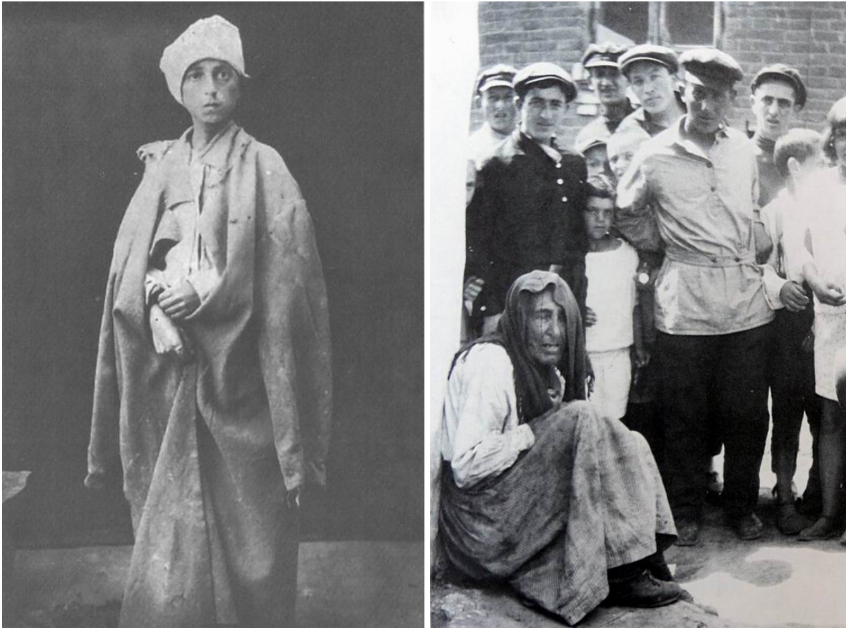
Жертвы погромов, 1919

похоронила не только перспективы еврейской автономии, но и шансы социал-демократии в тогдашней Украине. Еврейские лидеры попали в ложный круг надежд: принцип «молитвы за власть» (готовность к любым компромиссам ради социальной стабилизации), которым они руководствовались, обернулся дискредитацией в глазах населения. После волны погромов этот принцип означал лишь согласие на самоуничтожение.