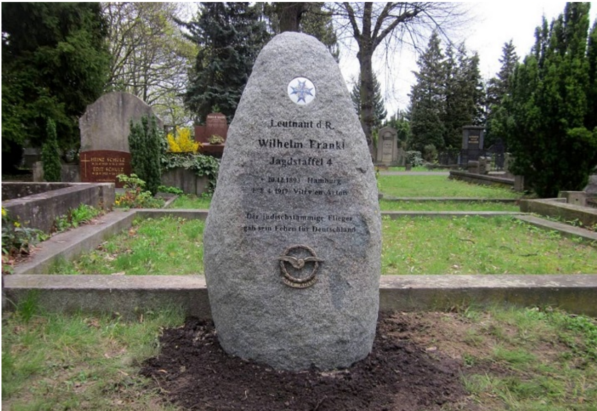
Новий надгробок пілота на кладовищі Charlottenburg-Wilmersdorf.

У 1930-х нацисти зруйнували могилу льотчика на берлінському цвинтарі Шарлоттенбург і виключили його ім'я зі списку героїв. Лише до 100-річчя від дня загибелі лейтенанта два німця — приватні особи — за власною ініціативою встановили на могилі новий надгробний камінь, — повідомляє «Гаарец». На пам'ятнику викарбувано: «Єврейський льотчик, який загинув за Німеччину».