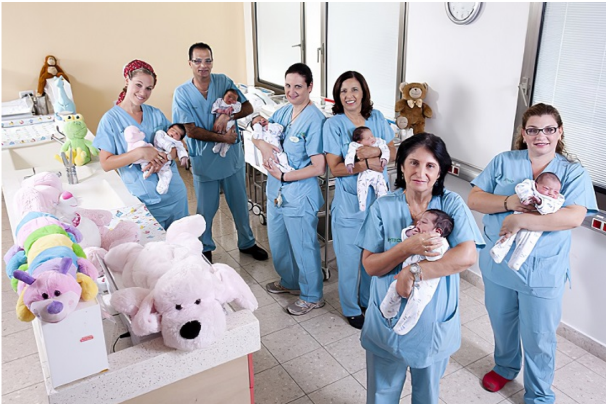
Родильное отделение в Медицинском центре им. Рабина, Тель-Авив

С чем у Израиля нет никаких проблем, так это с рождаемостью. В конце концов, это тоже будущее страны. Как известно, для простого воспроизводства (не роста) населения, каждая женщина должна рожать двух детей. Израильтянки имеют в среднем трех детей, и это намного больше, чем во всех странах Европы или даже в Турции или Бахрейне. В католической Ирландии суммарный коэффициент рождаемости (СКР) составляет 1,7, в Бельгии — 1,6, в Германии — 1,5, а в Италии — 1,3. Похожая картина в Восточной Европе, где в Венгрии и Болгарии СКР приближается к 1,6, а в Словакии и Польше — 1,5. Еще печальнее демографическая ситуация в Беларуси (1,4) и Украине (1,2). В этом смысле Израиль куда ближе к странам Средней Азии, особенно Узбекистану (2,8 ребенка на женщину) и Киргизии (3,3). Даже в Ливане СКР достигает всего 2,1.