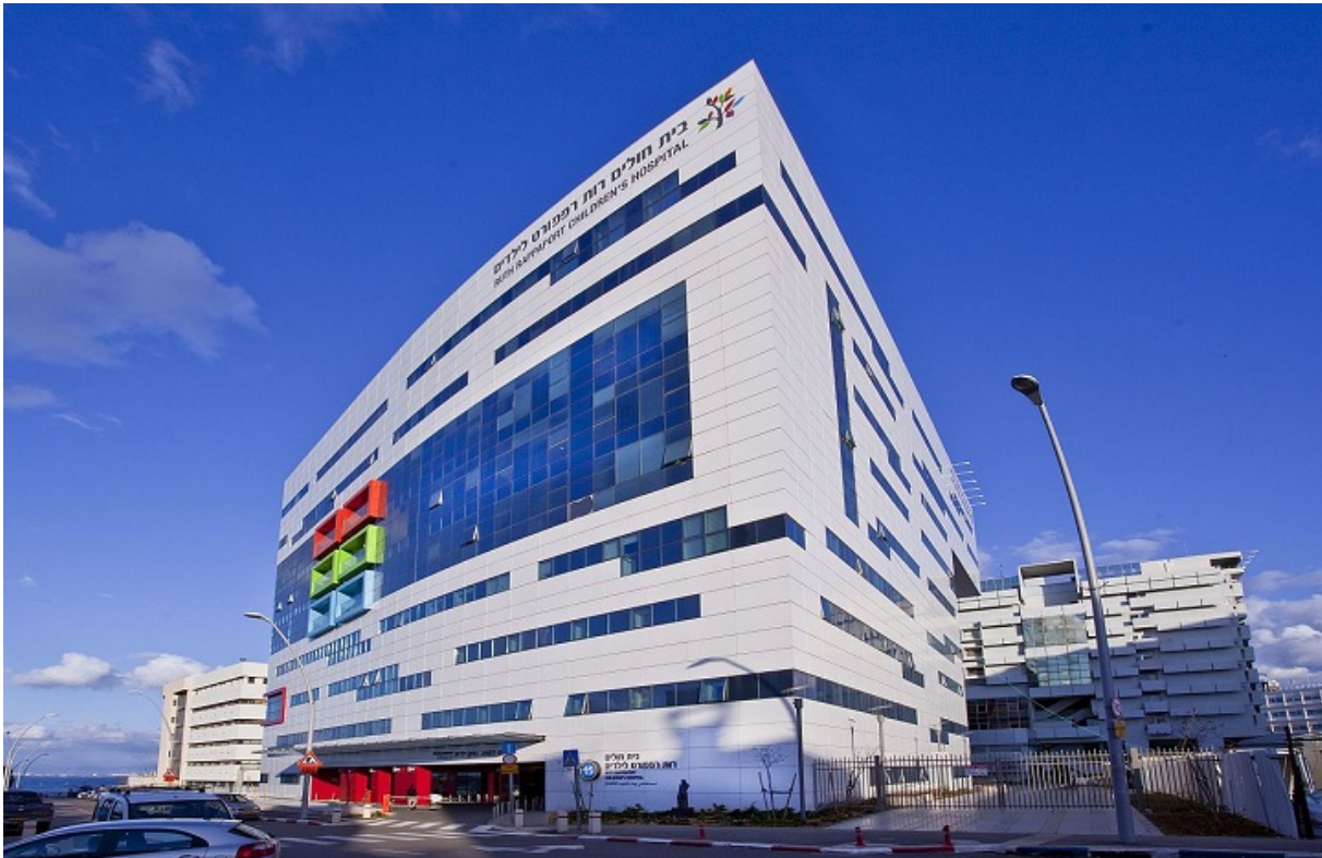
Детский центр в медицинском комплексе Рамбам, Хайфа

Весьма важным считается показатель расходов на здравоохранение на душу населения в той или иной стране. По данным ВОЗ, в Израиле речь идет о сумме в 3200 долларов. Меньше, чем в среднем по Западной Европе (около $5500), но выше, чем в Восточной (порядка $2500). К слову, Литва и Эстония в этом смысле — типичная Восточная Европа, а не бывший СССР, где данный показатель колеблется от $1500 (в России) до $260 в Киргизии. Это примерно сопоставимо с Ливаном ($1086) и Египтом ($614).