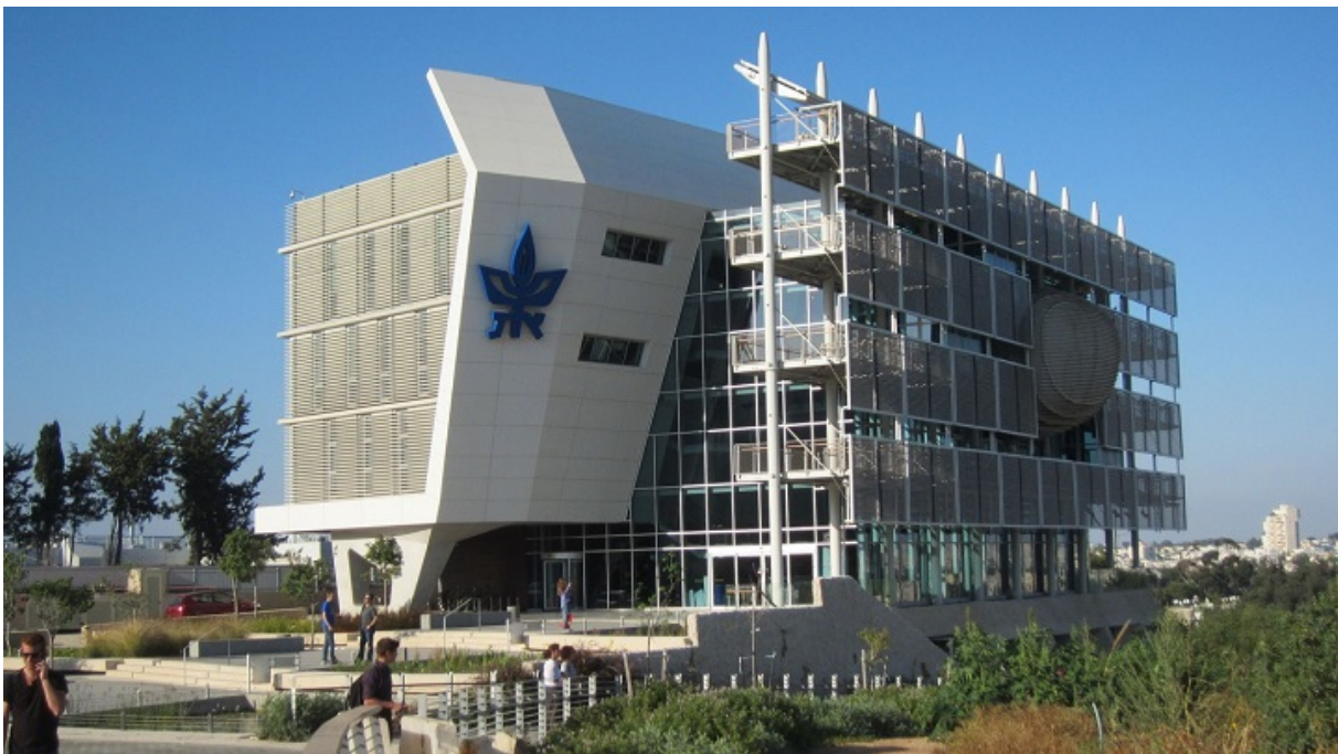
Один из кампусов Тель-Авивского университета

Образование во многом определяет будущее страны, поэтому клуб развитых стран — OECD — ведет статистику соответствующих расходов. В сфере школьного образования Израиль отстает от среднего показателя по OECD — $9200 в год против $10300. В странах Западной Европы эта цифра еще выше — около $12000. Разница в ежегодных затратах на каждого студента вуза еще разительнее. Здесь Израиль — на уровне Восточной Европы с показателем в $12500. Более того, еврейское государство уступает таким странам как Словения, Венгрия и Эстония.