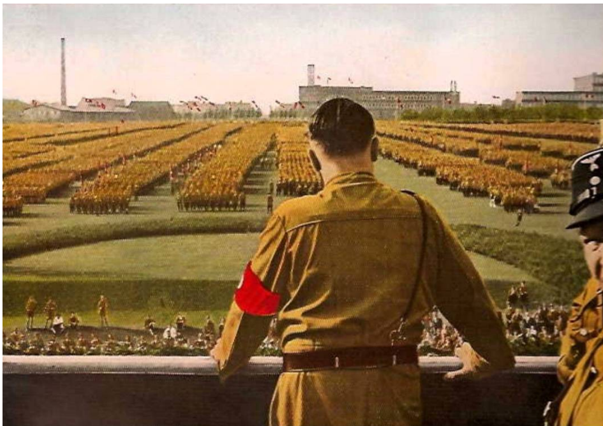
Фюрер принимает парад

Во время многолетнего мучительного пребывания в «еврейском доме» в Дрездене, наполненном ожиданием высылки в Освенцим или Терезиенштадт, в скитаниях последних месяцев по разоренной войной Германии Клемперер пропустил через свое сознание филолога, гуманиста, европейца весь окружающий его кошмар, фиксируя изменения в массовом менталитете, неизбежно происходившие под влиянием нацизма. Язык Третьего рейха проник повсюду, на нем говорили не только с трибуны, в газетной статье, он вошел в обиход. Скрываясь в доме своего друга-аптекаря, Клемперер читал безобиднейшую брошюру о целебных травах. Казалось бы, что может быть дальше от политики, чем это издание союза аптекарей? Но оцените только одну такую фразу: «Применение целебных трав в лечебных целях подтверждает то, что было известно нашим предкам, успешно использовавшим их целебные свойства в седой древности. Мысль о связи крови и почвы подкрепляет доверие, которое мы питаем к травам нашей родины».