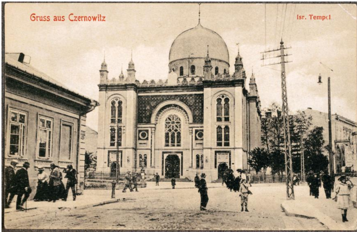
Темпл, открытка начала XX века

— Академическая конференция, да еще на столь специфическую тему, вряд ли привлечет внимание массовой аудитории... Какую культурную программу предложат горожанам в эту августовскую неделю?