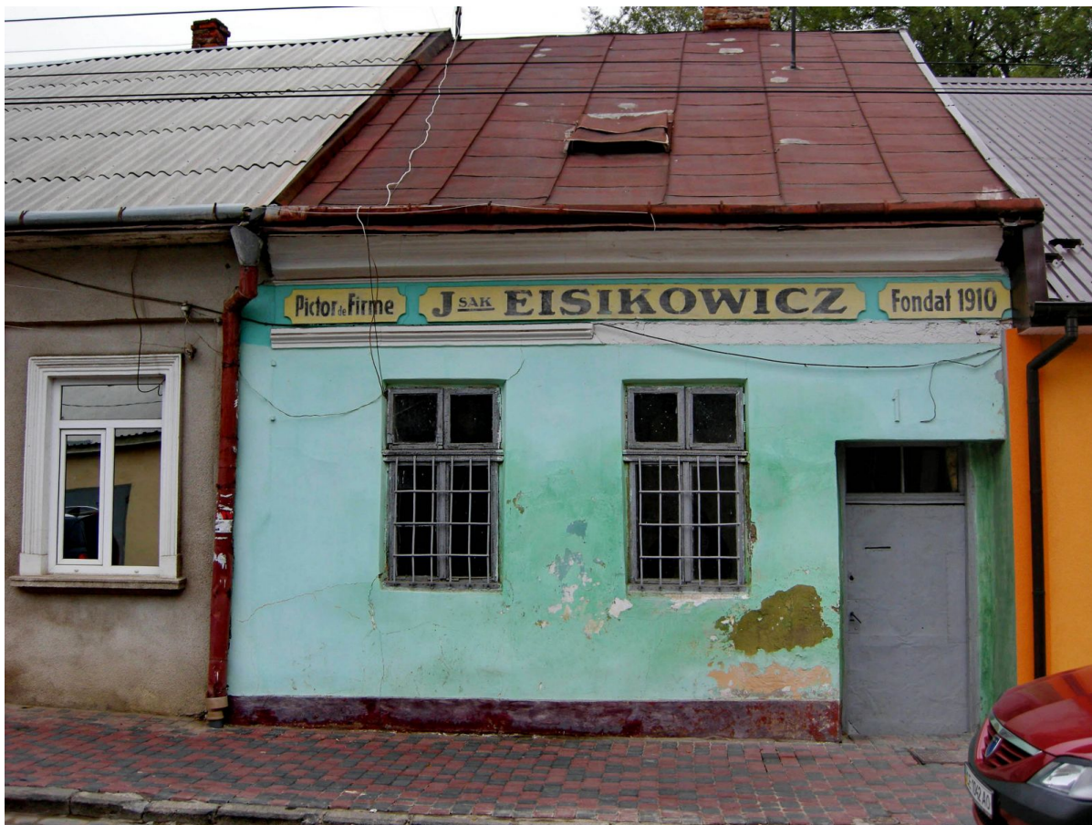
Фрагмент еврейской застройки Черновцов