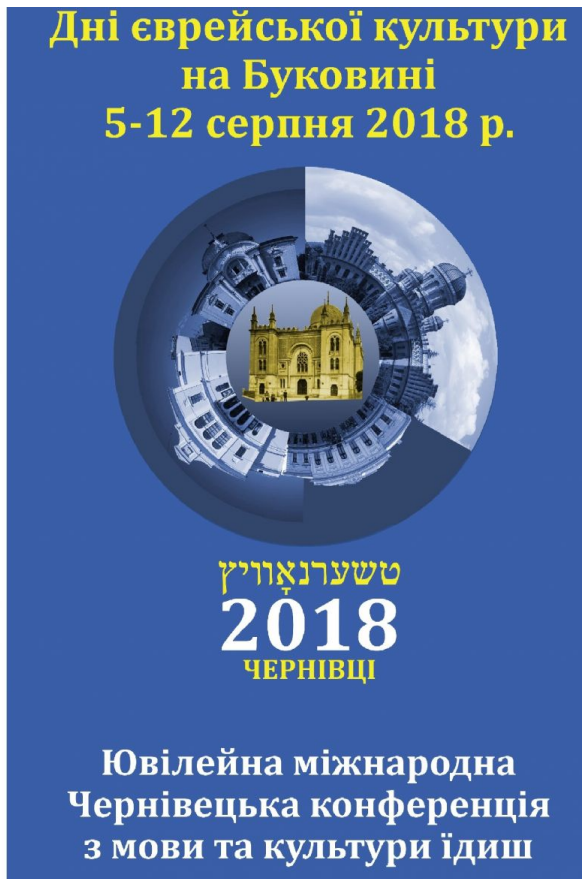
Баннер Дней еврейской культуры на Буковине