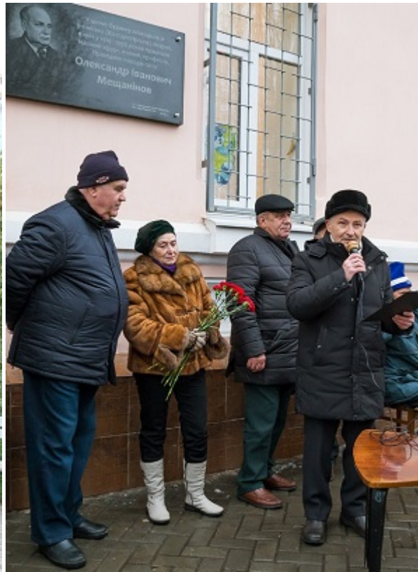
На открытии памятной доски.