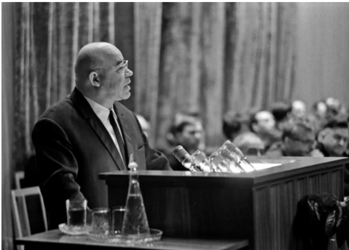
Выступает Петр Шелест, 1965 г.

В ином ракурсе рассматривал ситуацию первый секретарь ЦК КПУ Петр Шелест. В его дневниковых записях от 21-31 марта 1964 года есть такой абзац: