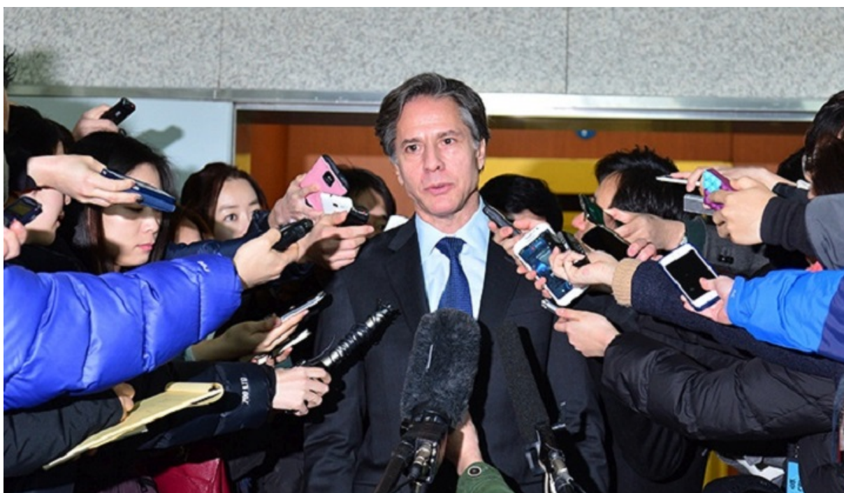
Энтони Блинкен.