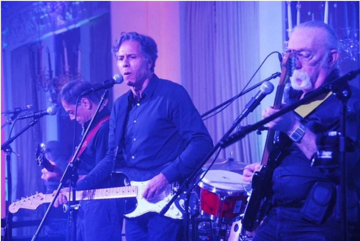
Блинкен со своей рок-группой выступает в посольстве Великобритании.

Что касается Энтони, то он окончил Гарвард и Колумбийский университет, занимался частной адвокатской практикой, работал в аппарате Совета национальной безопасности США в Белом доме, в 1994 — 1998 гг. был специальным помощником президента, в 2002-м стал директором сенатского Комитета по международным отношениям.