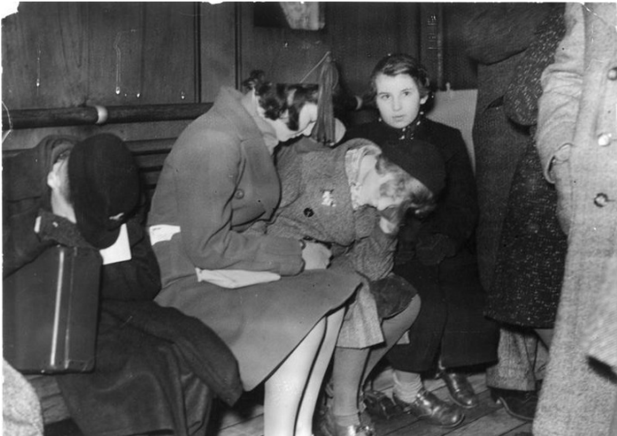
Первые дети прибывают в Лондон, декабрь 1938 год.

В 1938 году отделы платных объявлений газет Великобритании и США заполнили объявления: «Пожалуйста, приютите в своей семье ребенка с образовательными целями!» Постепенно многие из них слились в отчаянный хор: возьмите моего ребенка! И люди откликались.