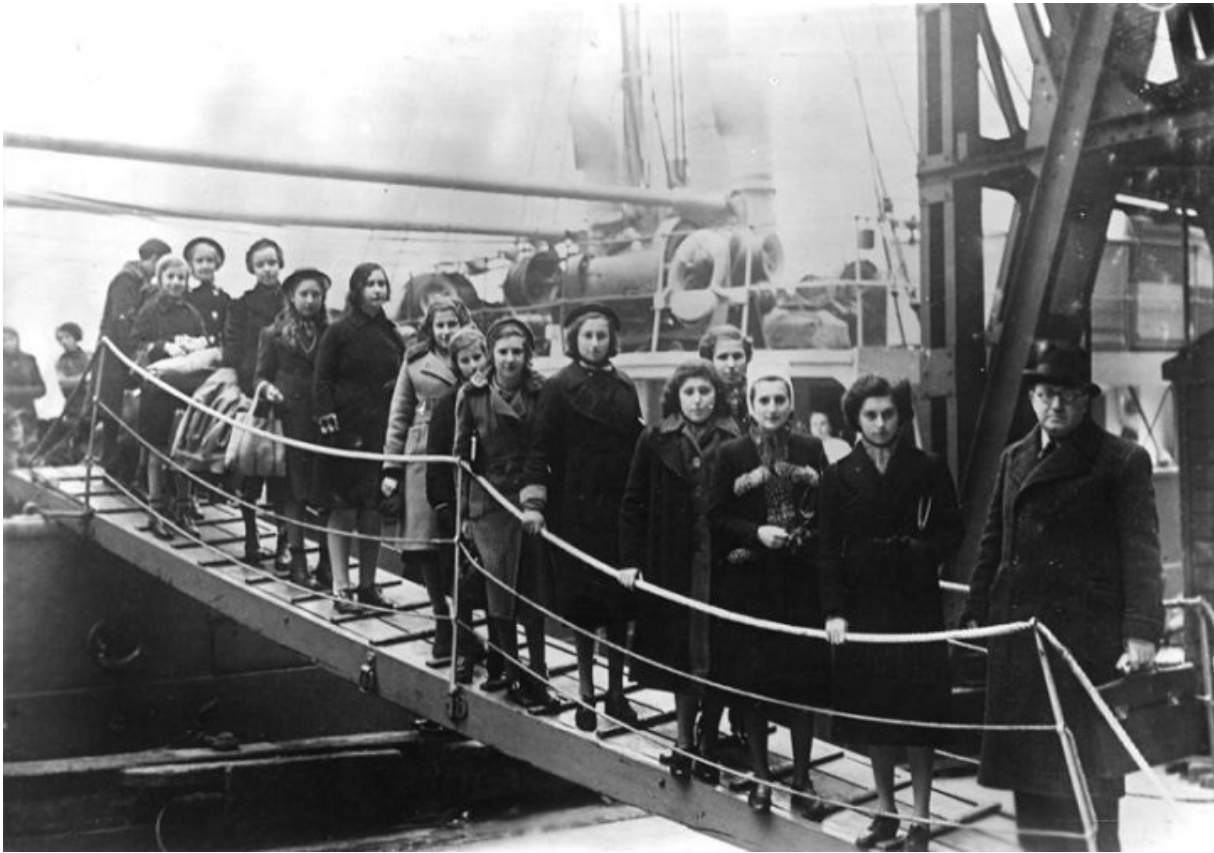
Прибытие беженцев в Лондон, февраль 1939 года.

У вокзала Ливерпуль-стрит в Лондоне стоит необычный памятник: на нем изображены дети — кто с медвежонком, кто с ранцем, кто с чемоданом; но все без родителей. Установленный в 2006 году мемориал посвящен еврейским детям, которых приняла Британия во время Второй мировой войны.