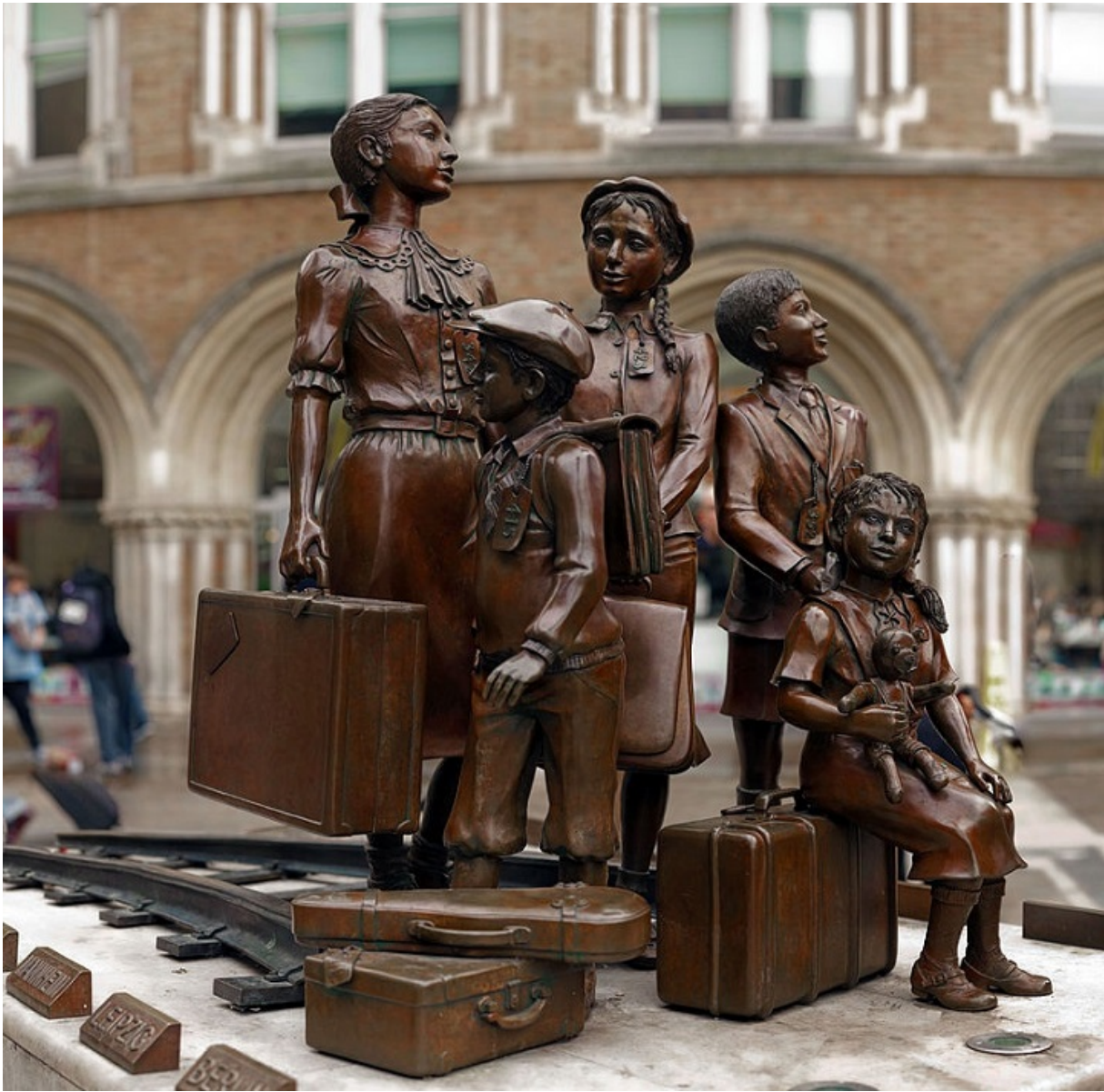
Памятник у вокзала Ливерпуль-стрит в Лондоне