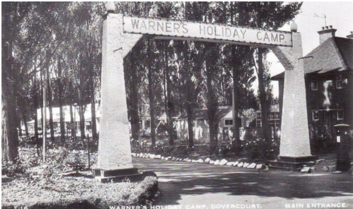
Лагерь, который использовался для размещения детей-беженцев