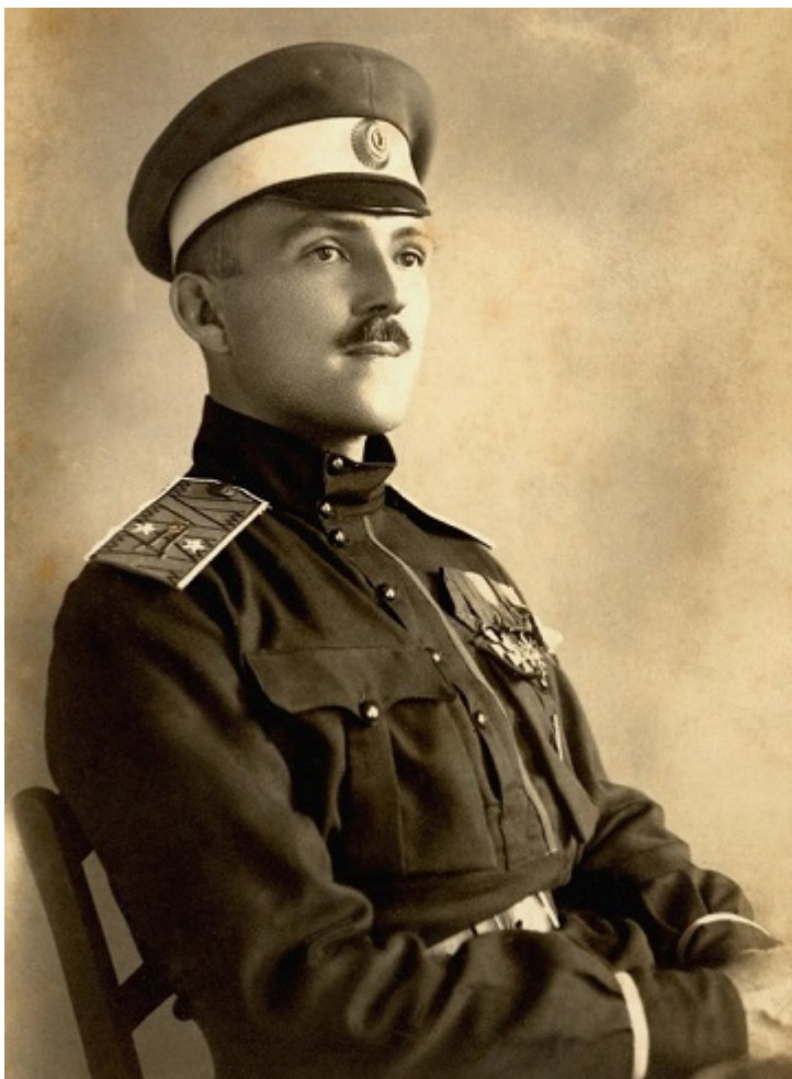
Генерал-майор Антон Туркул