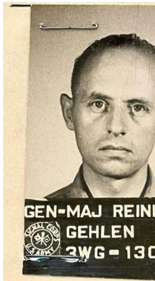
Генерал Гелен после ареста, 1945